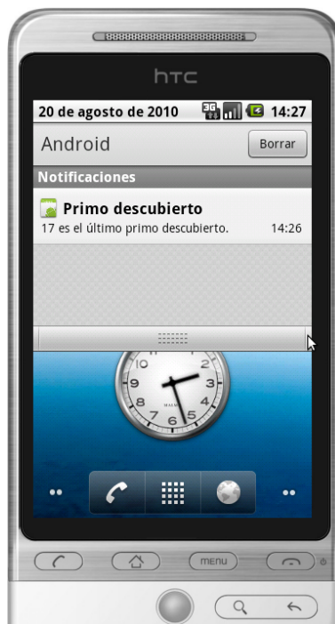
Notificación del servicio de números primos