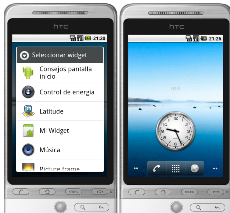
Instalación del AppWidget en el emulador

Si todo funciona correctamente, vamos a implementar en el MiWidget un servicio UpdateService que realizará la actualización del widget, evitando así bloqueos debidos a la velocidad de la red. El servicio recogerá la información que le devuelve en texto plano la página http://www.whatismyip.org y la mostrará en el campo de texto del widget.